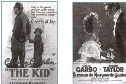
Американские кинофилмы 1920-х гг.

У американского «процветания» был красивый фасад — развитие массовой культуры. В жизнь обывателя вошел кинематограф, а с ним кумиры кино: Мэри Никфорд, Чарльз Чаплин и др. Ежедневные газеты выходили массовыми тиражами. Почти в каждом доме появилось радио. Каждый пятый американец (по усреднённой статистике) имел автомобиль, строились кинотеатры, стадионы для массовых спортивных зрелищ (хоккей, футбол, бейсбол и др.). Широкою популярностью приобретают джазовая музыка, модные танцы, демократизировались одежда, причёски. Новая техника меняла условия быта.