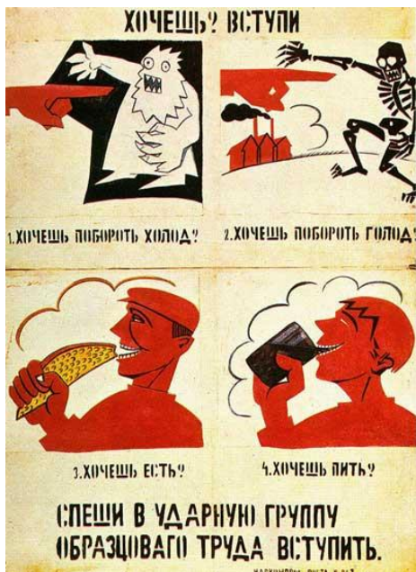
н. XX века