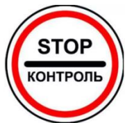
Отмена гос. контроля