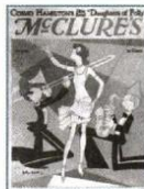
«Век джаза». США 1920-е гг.

В то время была изобретена формула «реклама плюс кредит равно процветание навсегда». Две трети автомобилей продавались в кредит. Но продажа в кредит — это долги. Между тем зарплата увеличивалась медленнее темпов роста производства и инфляции.