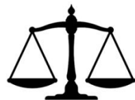
Удельный вес был невелик