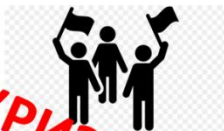
Всеобщая избирательная система