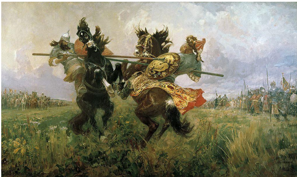
М.И. Авилов. Поединок Пересвета с Челубеем на Куликовом поле. 1943.