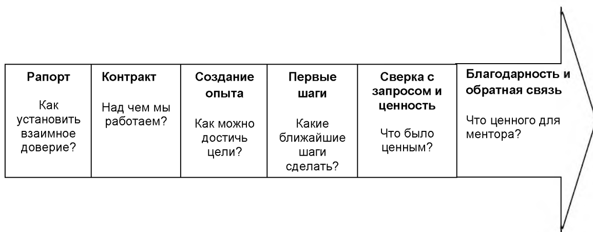
Рисунок. Структура менторской сессии в формате профессиональной развивающей беседы

Структура менторской сессии в формате профессиональной развивающей беседы представлена на рисунке.